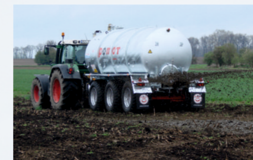
ŁYŻKA ROZLEWAJĄCA szerokość robocza od 8 do 12 m