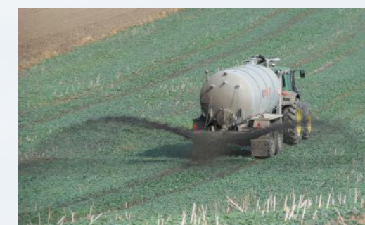
PODWÓJNA ŁYŻKA ROZLEWAJĄCA szerokość robocza od 14 do 18 m