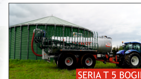
SERIA T 5 BOGIE