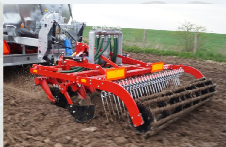
AGREGATY TALERZOWE szerokość robocza od 3 do 6 m