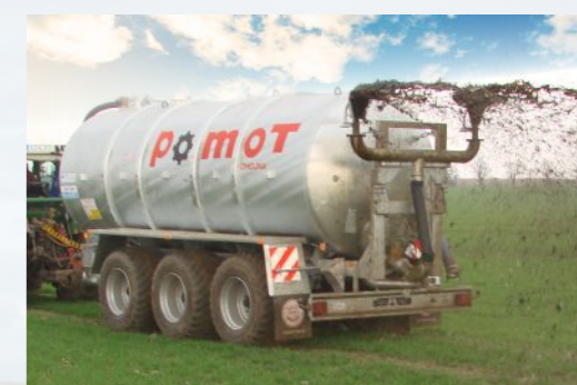
ROZLEWACZ DUPLEX szerokość robocza od 16 do 18 m