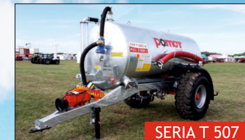
SERIA T 507