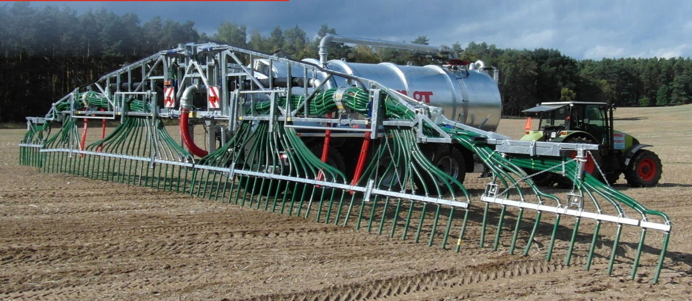
AGREGATY NAGLEBOWE W SYSTEMIE WĘŻY WLECZONYCH szerokość robocza 9m, 12m, 15m, 18m, 24m