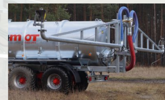
ROZLEWACZ DUPLEX szerokość robocza od 20 do 30 m