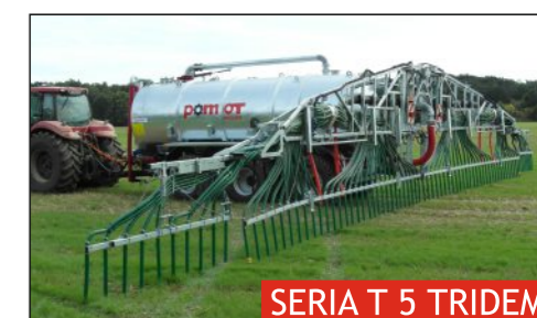
SERIA T 5 TRIDEM