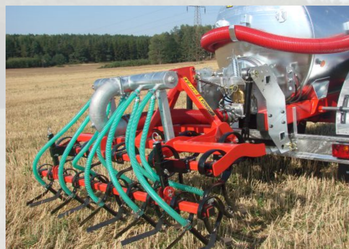
AGREGATY REDLICOWE szerokość robocza od 3 do 6 m