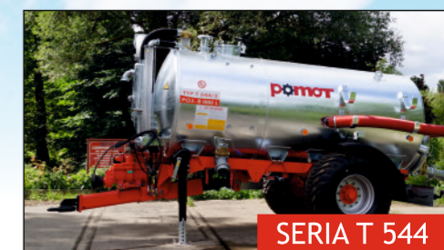
SERIA T 544