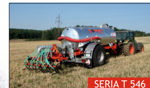
SERIA T 546