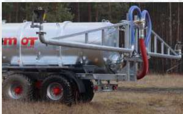
ROZLEWACZ DUPLEX szerokość robocza od 20 do 30 m