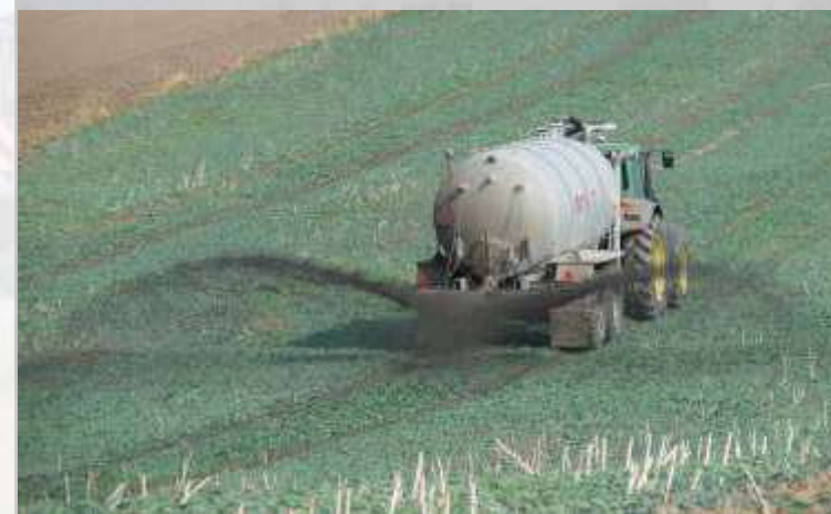
PODWÓJNA ŁYŻKA ROZLEWAJĄCA szerokość robocza od 14 do 18 m