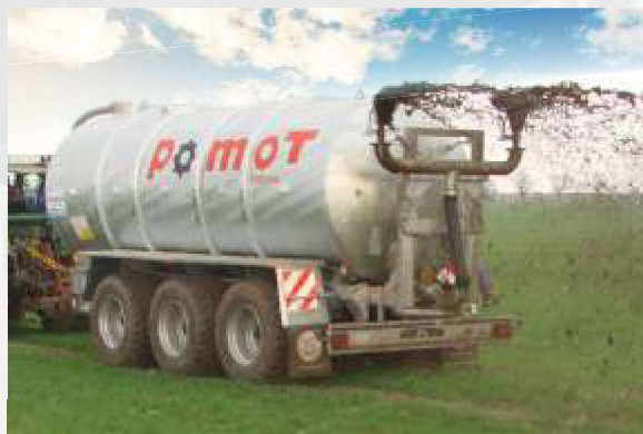
ROZLEWACZ DUPLEX szerokość robocza od 16 do 18 m

Właściwie dobrane rozlewacze do typu wozu asenizacyjnego przyspieszają pracę i zwiększają efektywność wykorzystania gnojowicy.