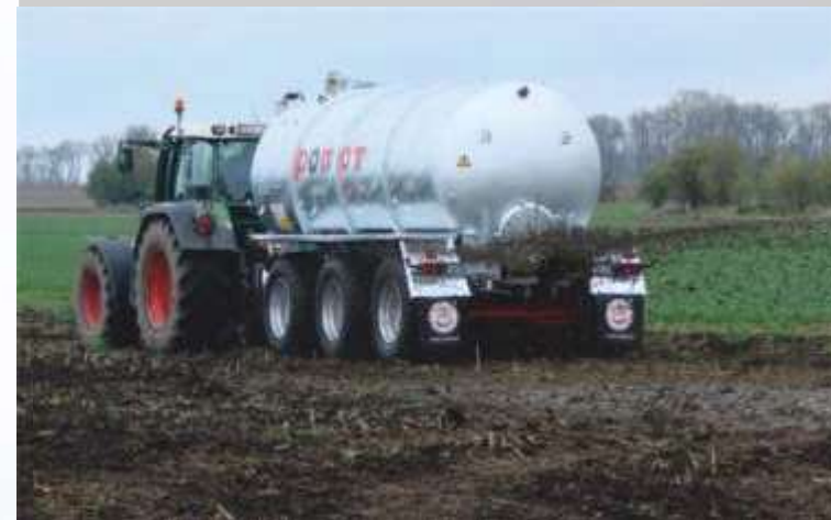
ŁYŻKA ROZLEWAJĄCA szerokość robocza od 8 do 12 m